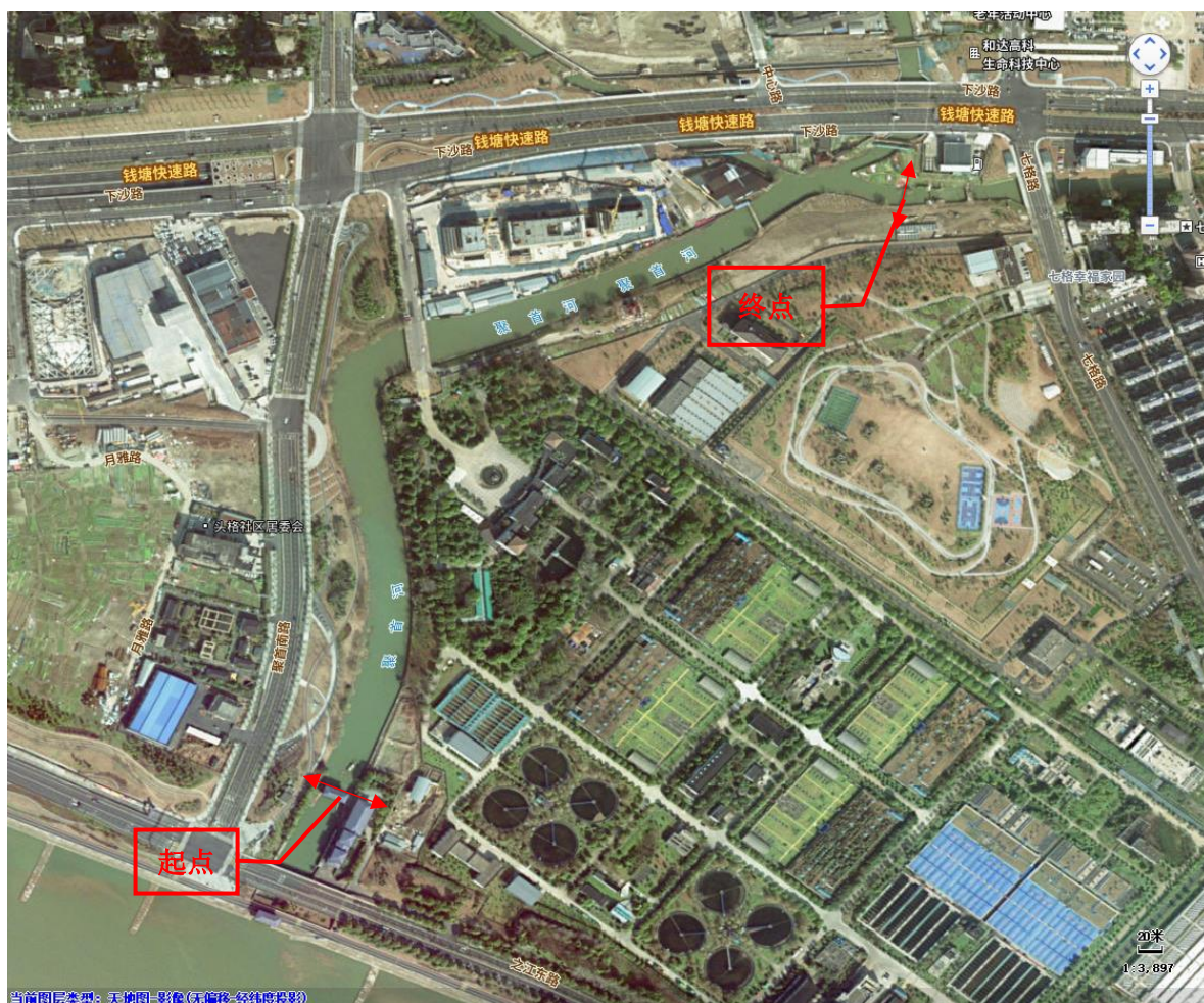
图 1 项目起点及终点示意图